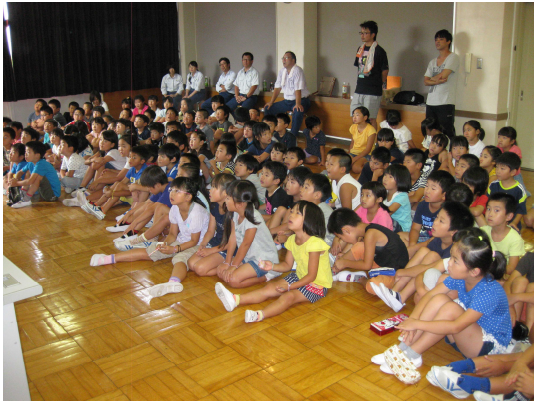
真剣に聞いてくれています(^-^)

8月3日(水)常陸大宮市にある学童保育園「子コロッコロ」(旧小場小学校)にて、夏休み期間中の約100名の小学生を対象に森林教室及び木工教室を行いました。 森林教室では、実験を交えながら土砂の流出を防ぐ役割などの、森林が持ついろいろな機能について学びました。 木工教室では、丸太切りやコースター、もっくん(キーホルダー)作りを行いました。