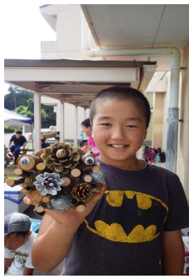
作ったものを手にパシャリ!

この森林教室で、森林の大切さや楽しさを「学び」「感じ」てもらえたのなら嬉しいです。 これを機に、もっと森林への興味・関心をふくらませ、森林とふれあっていただければと思います。