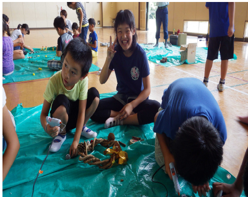
元気いっぱい笑顔で制作中(^o^)