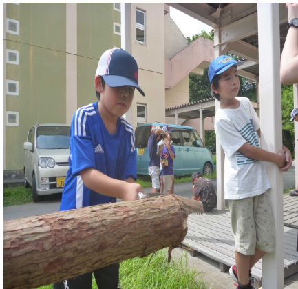
暑い中がんばりました(^_^)

当日は、日差しが照りつける暑い中での実施となりましたが、子ども達は大人が右往左往するほど元気いっぱいでした。 参加した子ども達からは「疲れるけど楽しい!」「もっとやりたい!」など元気な声がそこかしこから聞こえてきました。