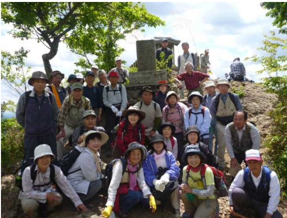
頂上で記念撮影。景色も良く楽しめました。

昼食後は、茨城県では珍しいブナ林を抜けて下山となりましたが、風も心地よく受講者の多くがすがすがしい表情となっていました。 下山後、「筋肉痛は3日後。」などと受講者から冗談(?)も飛び出て、一回目の現地学習は、事故もなく無事に終了することができました。 当署では、本講座の四回目に再度現地学習があり講師を務めることとなっています。次は初秋。また違った表情を見せてくれる山を歩きたいと思えます。 いん @