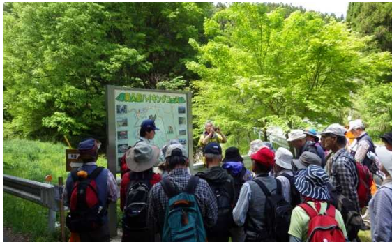
今日のルートを確認。安全に歩きましょう!