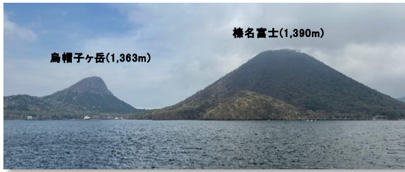
榛名湖畔からの榛名富士(右・高崎市)と烏帽子ヶ岳(左・東吾妻町)