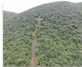
復旧治山工事 鍋割山(前橋市) (ロープネット工で斜面の岩石を抑えて落石を防いでいます。)

近年の集中豪雨でも山崩れが発生しており、直下の県道や住宅などを山地災害から守る必要があります。今後も崩壊地が拡大するおそれがある鍋割山や黒檜山東麓では、災害復旧のための山腹工などを実施しています。