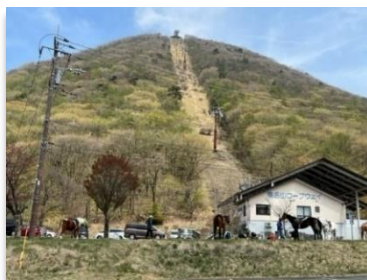
榛名高原駅から榛名山山頂駅(標高1,336m)にかかる榛名山ロープウェイ(高崎市)