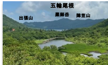
鳥居峠からの覚満淵(前橋市) (後方は大沼と五輪尾根。かつては鳥居峠からの景観があまりにも絶景であることから極楽浄土に例えられたそうです。)

また、赤城山は、昭和22(1947)年のカスリーン台風で大きな山崩れ等の被害を受けた箇所です。現在でも東側斜面には崩壊地が多くみられ、土砂流出の発生源となっています。