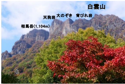
表妙義の最高峰・相馬岳などが連なる白雲山(富岡市) (妙義山は、大きく「表妙義」と「裏妙義」に分かれます。)