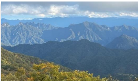
碓氷峠見晴台から見る妙義連峰(安中市) (見晴台から浅間山や裏妙義などの山々が見渡せます。)

妙義山のご神木を切ると天狗のたたりがあると村人が反対したようですが、「国のお役に立つ柱となるので神も許してくれるだろう」と尾高惇忠(富岡製糸場初代場長)が説得したといわれています。