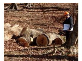
集中豪雨で発生した倒木の処理