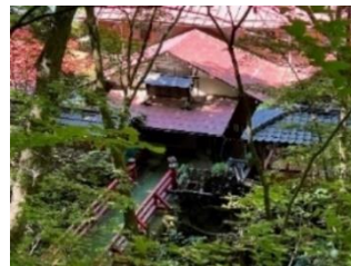
秘境に佇む霧積温泉(金湯館)(安中市) (「人間の証明」の舞台としても有名です。)

群馬森林管理署では、霧積温泉の周囲全域に指定した国有保安林を対象に、治山事業やアクセス道路の災害応急工事などに力を入れています。