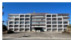
関東森林管理局庁舎内(前橋市)

群馬森林管理署は、高崎営林署を母体としており、明治24(1891年)高崎小林区署の発足から130有余年の歴史があります。