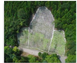
田沢地区(黒檜山東麓)(桐生市) (山腹工で崩壊した山の斜面の侵食や拡大崩壊を防いでいます。)