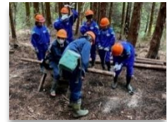
伐った間伐材から自分だけのコースターづくり