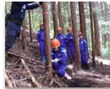
「森林体験活動」として間伐の作業体験