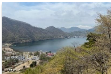
榛名富士山頂からの風景(高崎市) (眼下に榛名湖、関東平野や上州の山々が一望できます。)

榛名山系の一角には、地元中学校のための「学校林」を設定しています。毎年1年生が必ず履修する屋外授業(森林体験活動)には、群馬森林管理署からも職員を派遣し、授業の手伝いなども行っています。