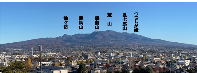
関東森林管理局庁舎上からの赤城山全景(前橋市) (裾野は富士山(35km)に次ぎ26kmにも及びます。)