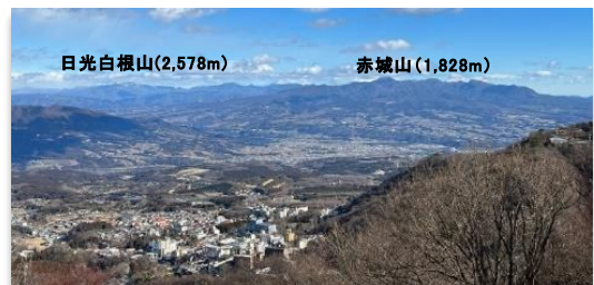
県道33号線(別称「秋名のダウンヒル」)途中の高根展望台からの伊香保温泉街(渋川市)

作中に登場するコーナーを愛車で走り、シンクロ感を味わうために、数多くのドライバーたちが聖地巡礼として訪れています。地元渋川市では、「伝説の走り屋たちの聖地をめぐる!」のキャッチフレーズでコラボレーション企画を実施しています。