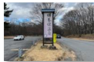
秋名のダウンヒルバトル「スタート地点」(作中では「秋名温泉」の看板)

主人公の走りの本拠地「秋名山」は榛名山をモデルとした架空の山ですが、秋名山のダウンヒルバトルで登場する「スタート地点」や「5連続ヘアピン」の峠道は、伊香保温泉街と榛名山を結ぶ「県道33号線」にあり実在します。