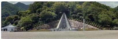
慰霊の園(日航機墜落事故慰霊碑)(上野村)

事故現場には慰霊碑(昇魂之碑)(写真右)が立てられています。毎年8月12日には麓にある「慰霊の園」(写真左)で追悼慰霊式が行われています。