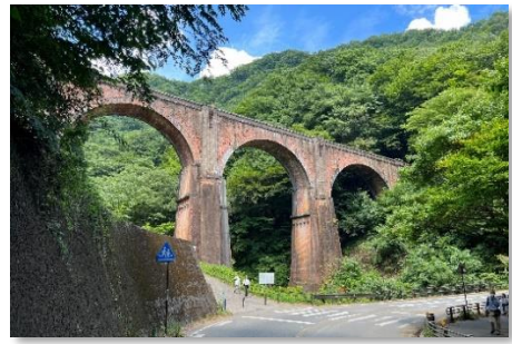
碓氷第三橋梁(めがね橋)(安中市) (明治25(1892)年完成の煉瓦造りの橋梁(国重要文化財))

アプト式鉄道は電気機関車の発達から昭和38(1963)年に廃止、また新幹線の開通から横川駅・軽井沢駅区間の鉄道が廃止(平成9(1997)年)され、その後は背後の国有林野の中に、めがね橋やトンネルを含めた「アプトの道」(遊歩道)が整備されています。歴史と自然を満喫しながらのハイキングが楽しめます。