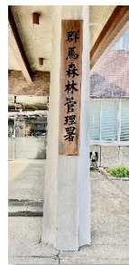
庁舎入口・左柱に関東局 右柱に群馬署の看板

組織改革等により前橋営林署、大間々営林署を統合し、上州の象徴・上毛三山のほか、栃木県境、埼玉県境、長野県境や市町村界の近くに偏在する広範囲な国有林野を継承して管理しています。