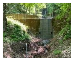
土砂から守る治山ダム