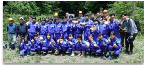
高崎市立倉洲中学校1年生の皆様(高崎市)

榛名山系の一角には、地元中学校のための「学校林」を設定しています。毎年1年生が必ず履修する屋外授業(森林体験活動)には、群馬森林管理署からも職員を派遣し、授業の手伝いなども行っています。