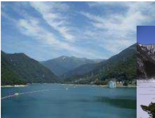
ダム湖と周辺の風景林