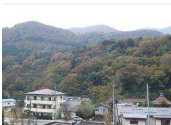
板室温泉街と風致探勝林