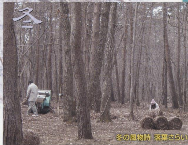
冬の風物詩 落葉さらい