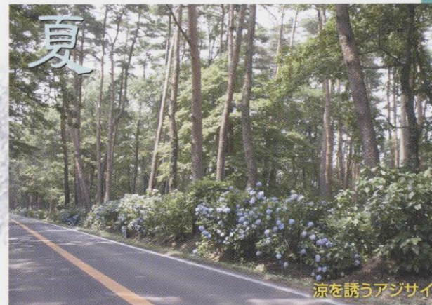
涼を誘うアジサイ