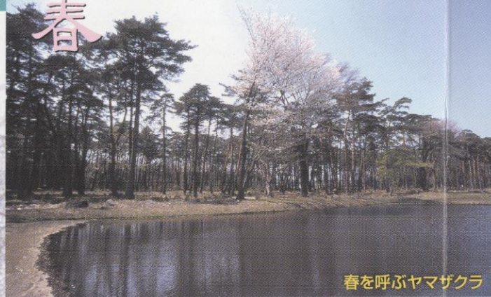
春を呼ぶヤマザクラ