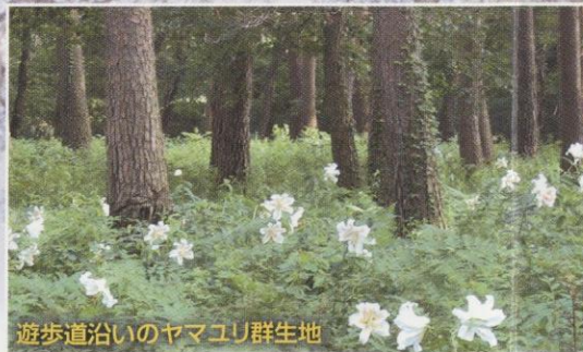
遊歩道沿いのヤマユリ群生地

那須街道沿いのウッドチップ舗装区間1.5km(コース図A-E)は車いすの通行も可能です。那珂川に面した区間(コース図A-G)は、遠くにせせらぎを聞きながら静かな散策を楽しめます。