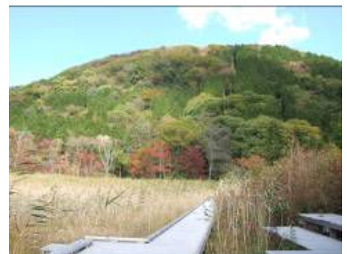
初秋の富士山とヨシ沼

東北自動車道西那須野塩原 I C 下車後、車で 2 1.6km 上ノ原入口下車後、徒歩 35 分