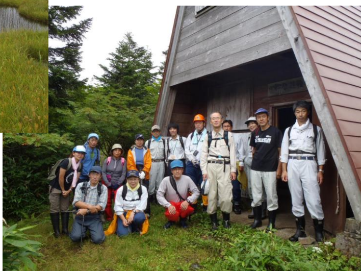
避難小屋で記念撮影 皆様、お疲れさまでした！

参加者からは、「毎年駆除しているのになかなか減らない」「範囲は一部拡大しているが、駆除区域の繁茂は確実に抑えられつつある」等の感想が聞かれました。小松原湿原の保全のため、この事業を継続させることが大事であると改めて実感した1日となりました。この事業が少しでもオオハンゴンソウの蔓延防止に繋がることを祈りつつ、今年度の作業を終了しました。