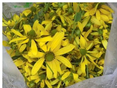
種の散布を防止するため、 花は花だけで集めました