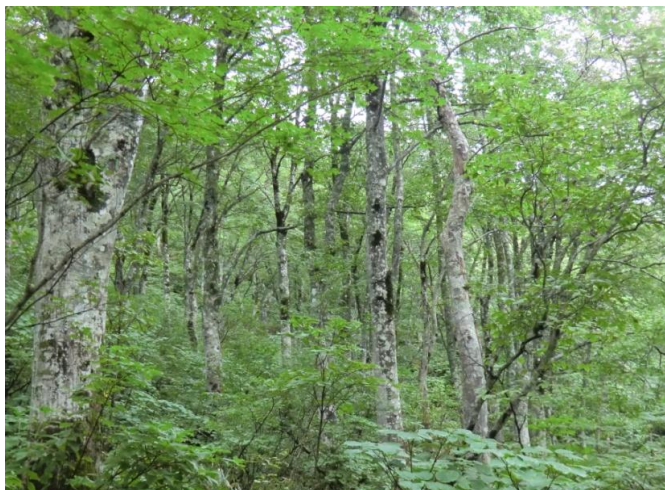
美しいブナの林を通ります

駆除作業終了後、小松原湿原の良さを多くの人に知ってもらうため、希望者を募り散策をしました。案内して下さったのは、「清津山の会」会員の皆様です。