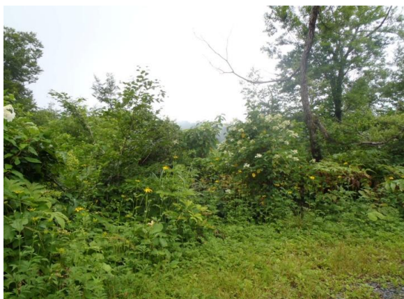
駆除前の写真 林道脇に繁茂しています

この事業は、新潟県自然環境保護地域に指定されている小松原湿原付近の小松原林道沿線においてオオハンゴンソウが確認されたため、その貴重な自然資源を守るために平成22年度から継続実施している事業です。