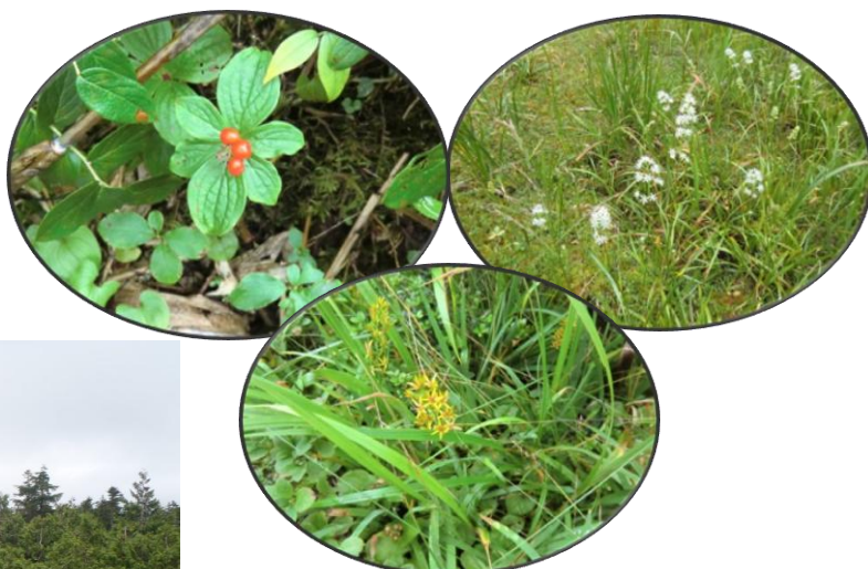
湿原を彩るさまざまな植物