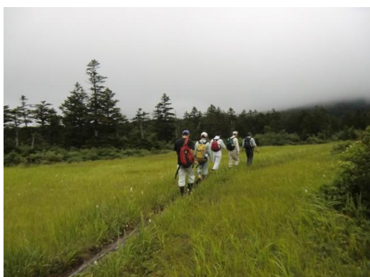
曇っていましたが、写真よりも明るく感じました