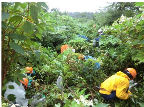
こんなところにまで！の声