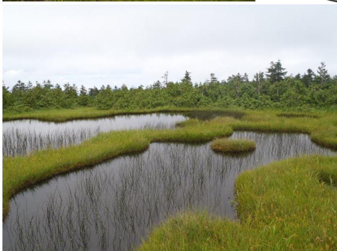
小松原湿原の一部です