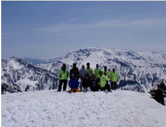
苗場山を背に地元ツアースキーガイドと記念撮影

私が勤務している湯沢森林事務所は、新潟県南部の湯沢町に位置し、群馬県や長野県との県境付近の約13,800㏍の国有林を管轄しています。