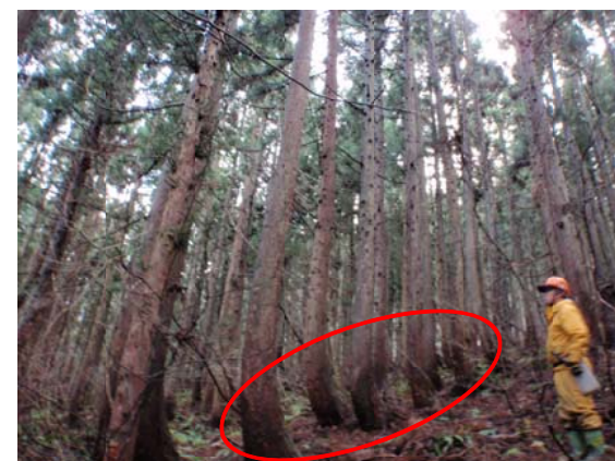
根曲がりしたスギ立木

なり広い範囲となるので隅々までというのは難しいのですが、情報提供という面では、地元住民、地元役場、地元業者、スキー場関係者、電力会社等の方々のご協力を得ることができ、非常に助かっています。