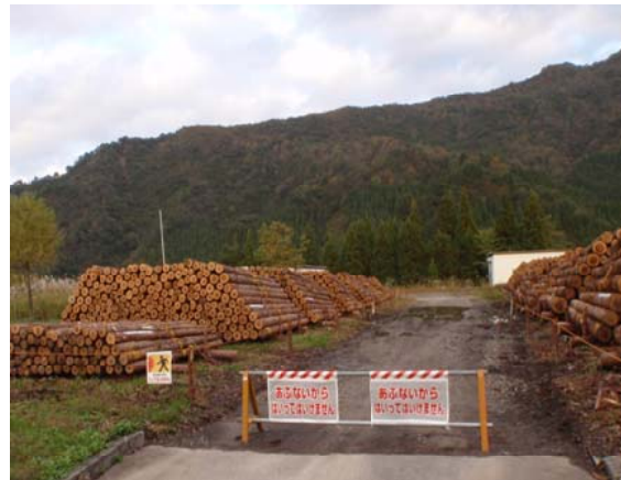
公売するために集積されたスギ丸太

私は、三国森林事務所管内の仕事も併任しており、常用作業員と臨時職員を合わせた3名で、毎日、山を駆けずり回っています。か