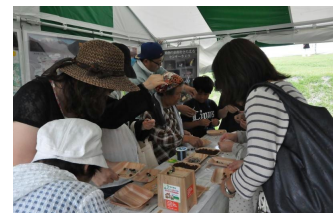
ストラップづくり

平成25年8月25日（日）群馬県立森林公園「21世紀の森」で開催されました。出展した利根沼田森林管理署のブースでは、しおりづくり等を行いました。今年は、署の好意によりテーブル1枚のスペースをいただきました。赤谷センターでは、赤谷プロジェクトのパネル展示とネイチャークラフト体験（ヒノキ球果のストラップづくり）を行いました。