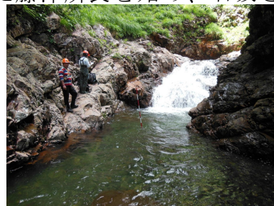
溪流環境調査の様子