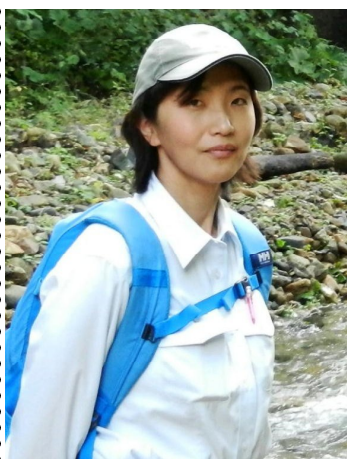
上席自然再生指導官

忙しい一年になるかな、という予感がありました。ほとんど勢いで始めてしまった溪流調査だけとは頑張ったのですが、完成できずに降板となりました。