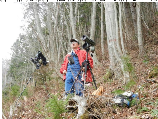
猛禽類調査の様子

在職中はいろいろお世話になりました。今後は赤谷プロジェクトを知るみなかみ町民のひとりとして皆様のご活躍を祈念致します。