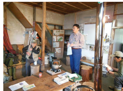
ミーティングの様子