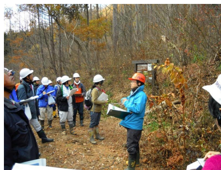
林野庁研修の様子

来年度も引き続き、赤谷プロジェクト地域協議会、(公財)日本自然保護協会、各WG委員のみなさま、そして、赤谷プロジェクト・サポーターのみなさまと協働して赤谷プロジェクトの推進に努めていたいと思います。