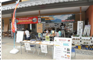
赤谷プロジェクトブース

平成25年度8月3日（土）8月赤谷の日を利用して、赤谷プロジェクト主催（共催：みなかみ町環境課）で、まんてん星の湯（群馬県みなかみ町猿ヶ京温泉）をメイン会場として「赤谷の日祭り」を開催しました。