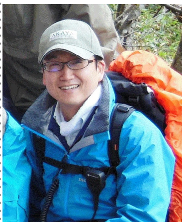
上席自然再生指導官

平成25年10月に着任して以降、林野庁研修や環境省自然保護官研修の講師など「所長の出番」が多い中、また、10数年ぶりの現場に加えて初めての猛禽類調査など盛りだくさんの業務の中、経験豊富な赤谷センターのすけさん、かくさん？に支えられ、何とか平成25年度を乗り切ることができました。