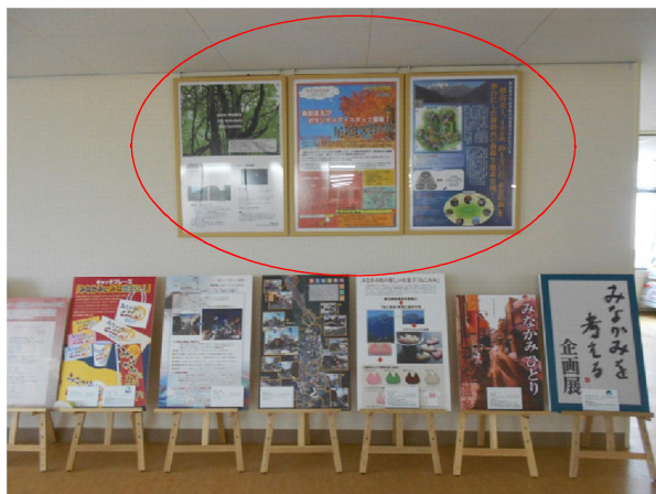
利根沼田広域観光センター