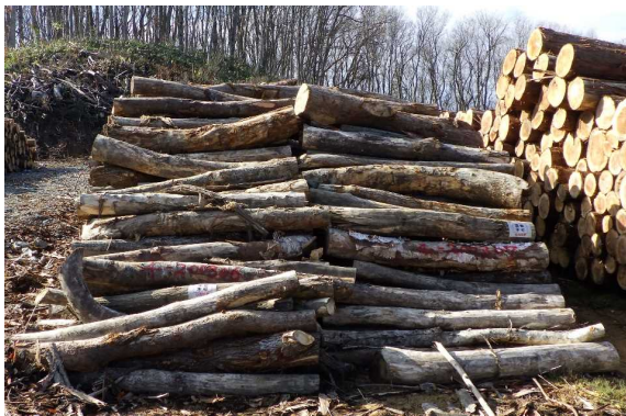
桧番号04-200306 (左側) 桧番号04-200307 (右側)