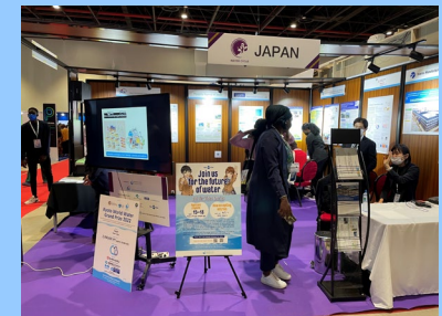
関係省庁・団体・企業合同の日本ブース