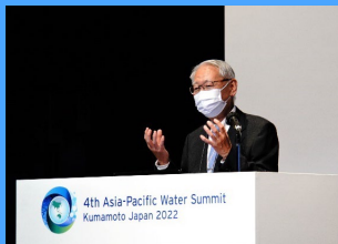
谷名譽教授による基調講演