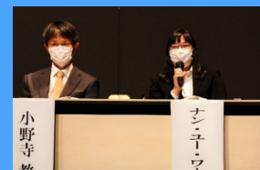
全講演者をパネラーとしたディスカッション