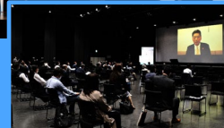
(小坂森林整備部長挨拶)