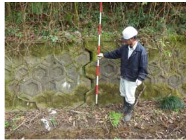
⑤ ブロック積亀裂状況