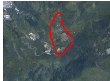
③ 事業対象区域全景