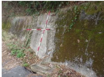
② コンクリート擁壁亀裂状況