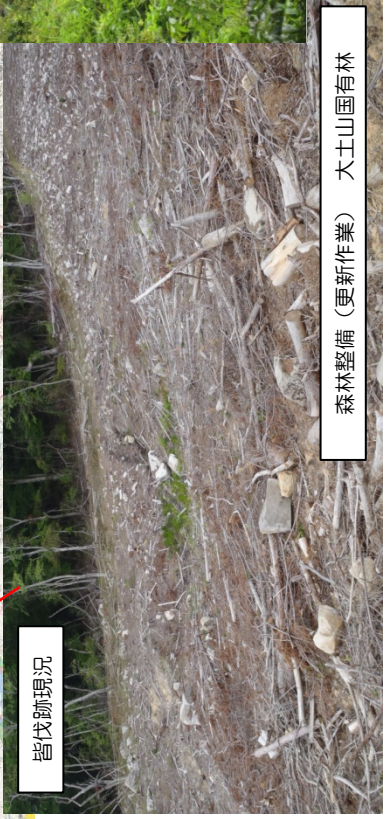
森林整備（更新作業） 大土山国有林