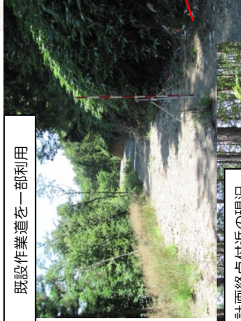
計画終点付近の現況