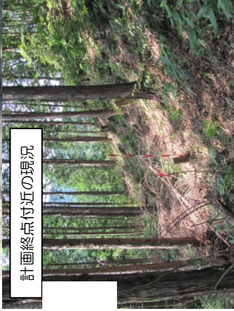
計画終点付近の現況