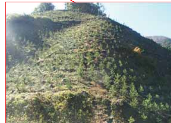
下刈作業 (多野郡神流町)