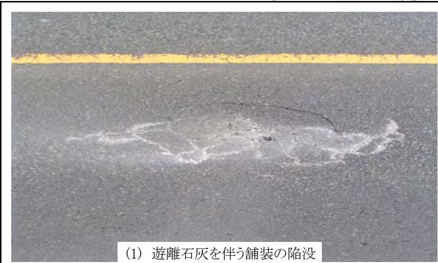
(1) 遊離石灰を伴う舗装の陥没