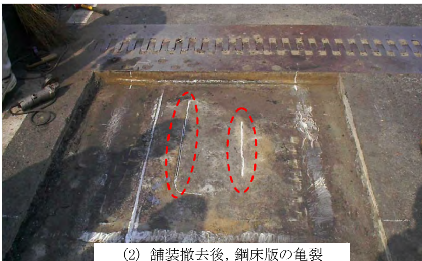
(2) 舗装撤去後、鋼床版の亀裂