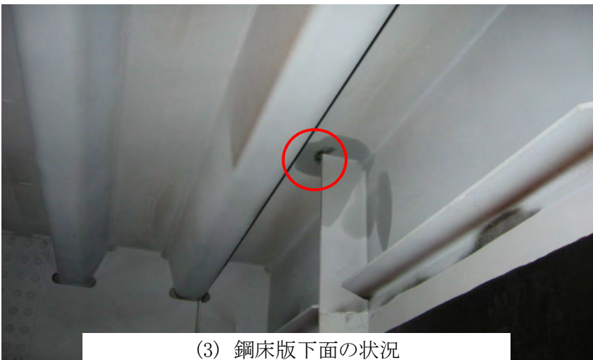
(3) 鋼床版下面の状況