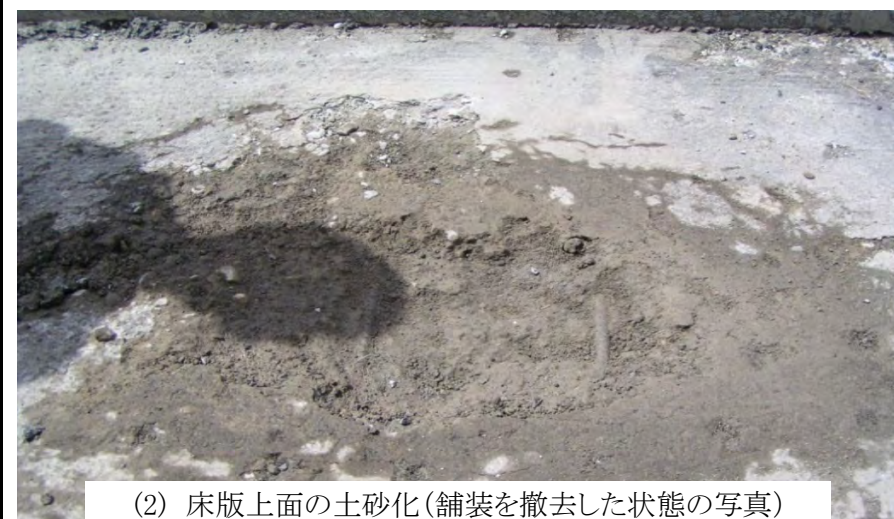
(2) 床版上面の土砂化(舗装を撤去した状態の写真)

舗装を撤去してコンクリート床版の上面を確認すると、コンクリートが著しく劣化し、土砂化していた事例であり、この場合、内部の鉄筋が腐食していた。