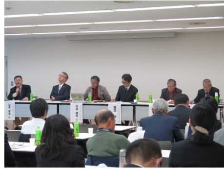
パネルディスカッションの実施状況