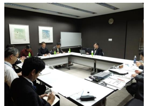
検討委員会の開催風景（第 2 回）