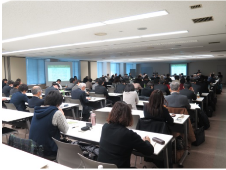
100名を超える参加があった