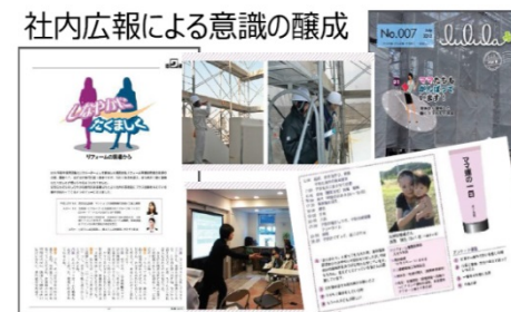
日本経済団体連合会(2016) 「ダイバーシティ促進に向けた取組み事例集」p.5