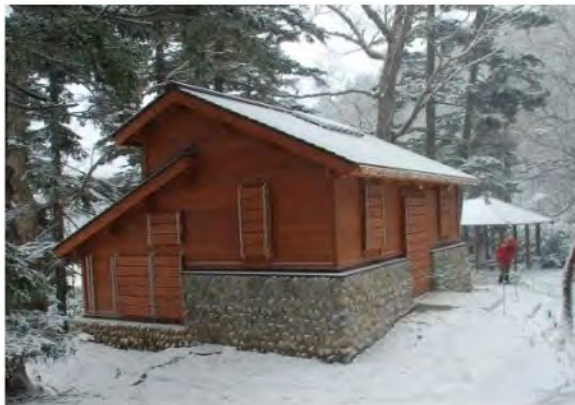
(志賀山周回線歩道公衆トイレ)