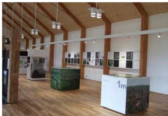
(円山園地ビジターセンター)