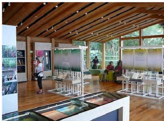
(那須平成の森フィールドセンター)