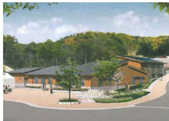
(国営アルプスあづみの公園 穂高ゲート)