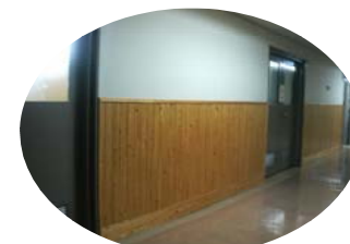
庁舎（農林水産省本省）