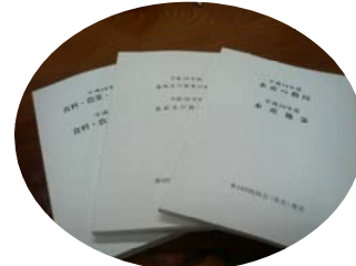
間伐材印刷用紙を用いた白書