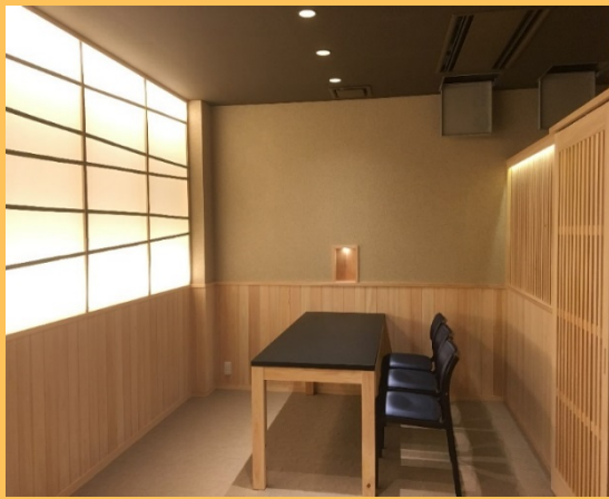
木質化されたホテルのレストラン