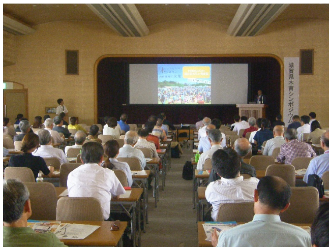
滋賀県木育シンポジウム

平成29年3月22日に、全国の都道府県ではじめての「ウッドスタート宣言」を行い、全国で木育活動に取組む東京おもちゃ美術館との間での調印式を執り行った。同年9月15日には、シンポジウムを開催し、木育実践者によるパネルディスカッション等を実施。自治体職員、森林・林業、保育所等の関係者及び一般県民等で会場は満員となり、県内の木育の取組事例に聞き入った。