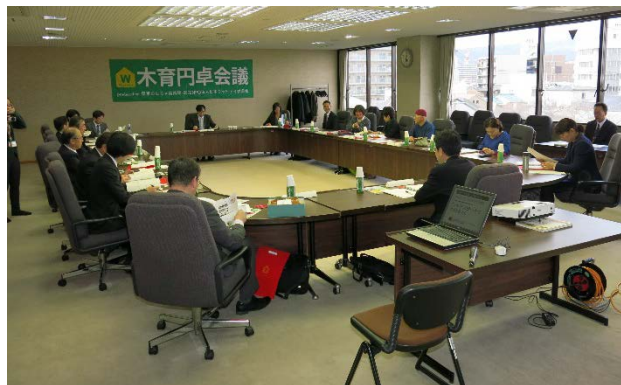
木育円卓会議in滋賀2015