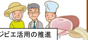
ジビエ活用の推進