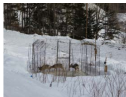
囲いわなによる捕獲

シカ被害の深刻な地域において、市町村や森林管理署等から構成される広域の協議会が計画を策定し、地域の連携により囲いわな等による捕獲や、防護柵設置等の防除活動を実施。