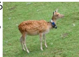
GPS首輪を用いた行動追跡調査

シカの侵入が危惧される地域等において、監視体制の強化を図るため、GPS首輪による行動追跡調査、自動撮影カメラによるシカの出没状況の調査等を実施。