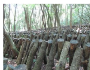
広葉樹の活用による原木しいたけ生産

○広葉樹材の活用による原木しいたけの生産性や品質向上のために必要な生産資材の導入を支援。