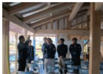
住宅の設計者等への研修会