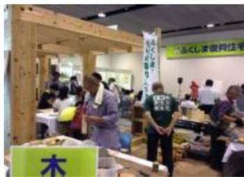
木造住宅の展示会