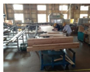
部材の標準化の検討