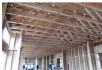
木質部材や工法の開発・普及