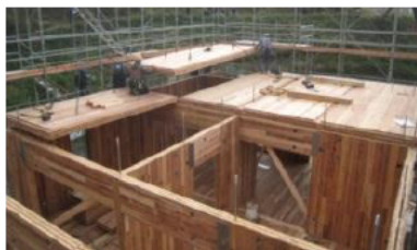
施工性のデータ収集等を目的としたCLT建築物の実証

○CLT(直交集成板)建築物の実証、地域の特性に応じた木質部材や工法の開発・普及等の取組を支援。