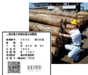
QRコード等での在庫管理による流通の合理化