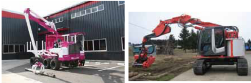
先進的な林業機械の開発