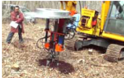
育林機械・技術の開発と分析・評価