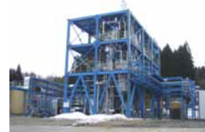
木質バイオエタノール製造