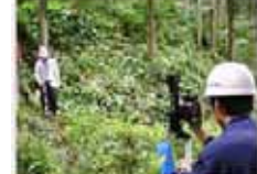
間伐のための境界特定