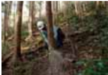
間伐の実施や 林道までの搬出、作業道・作業路の作設