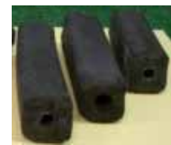
木炭、きのこの生産加工施設

上記の支援を受けるためには、地域の地方公共団体、森林組合等の林業事業者・林業経営体、木材加工業者、木質バイオマス需要者等で構成される協議会を設立し、事業計画を作成する必要があります。