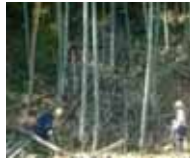
侵入竹の除去、病虫獣 害対策、広葉樹植栽