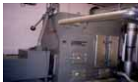
公共施設のボイラーの改良