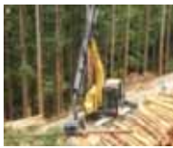
集材から造材、運搬に必要な機械の導入