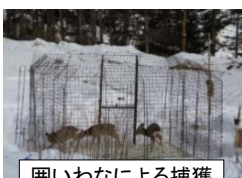
囲いわなによる捕獲

シカによる森林被害が深刻な地域等において、地域の連携による捕獲やジビエへの有効活用のための効率的な情報提供等をモデル的に実施。