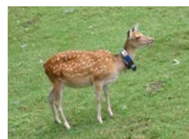
GPS首輪を用いた行動追跡調査

シカの侵入が危惧される地域等において、監視体制の強化を図るため、GPS首輪による行動追跡調査、自動撮影カメラによるシカの出没状況の調査等を実施。