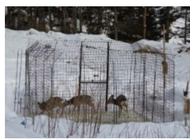
囲いわなによる捕獲

シカ被害の深刻な地域において、市町村や森林管理署等から構成される広域の協議会が計画を策定し、地域の連携により囲いわな等による捕獲や、防護柵設置等の防除活動を実施。