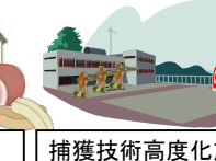
捕獲技術高度化施設