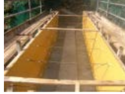
土木等新規分野での木材利用の実証・普及