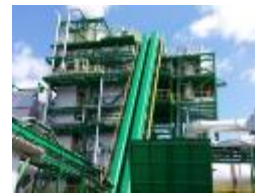
木質バイオマスの利用拡大に向けた相談窓口の設置、燃料の安定供給体制の強化、技術開発等の支援