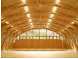
設計段階からの技術支援や木造と他構造の設計を行い両者のコスト比較により木造化へ誘導