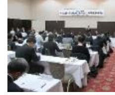
川上から川下の関係者、国有林及び都道府県が広域に連携した協議会での、需要見通し等に関する情報の共有化