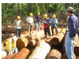
「クリーンウッド法」の施行に向け、違法伐採関連情報を提供。事業者登録の推進、協議会による教育・広報活動の取組を支援