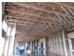
店舗等低層非住宅建築物の木質化に向けた取組の支援