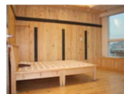
日本産木材により内装木質化したマンションモデルルームによる展示・PR等の取組を支援