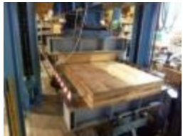
CLTの汎用性拡大に向けたCLT強度データ等の収集