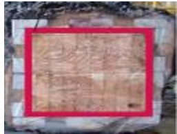
中高層建築物等の木造化に向けた木質耐火部材等の開発