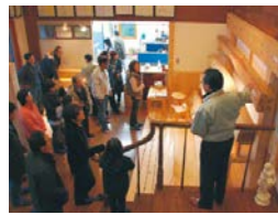
川上と川中、川下が行う地域材利用拡大の取組や、木づかいや森林づくりに対する国民の理解を醸成する普及啓発の取組への支援