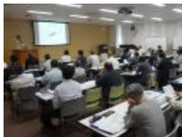
木材を利用した建築物に携わる設計者等を育成する取組の支援や木材の健康効果・環境貢献等の評価・普及