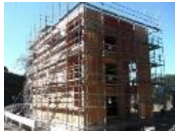
CLTの施工方法の確立及びコストダウンに向けたCLTを活用した先駆的建築の支援