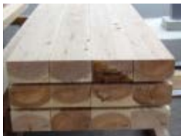
製材品の需要創出・高付加価値化等に向けた製品・技術の開発・普及