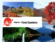
多言語ウェブサイト整備