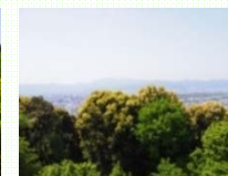
眺望を阻害している森林