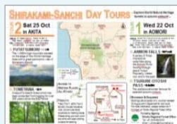
多言語パンフレット作成