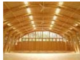
設計段階からの技術支援や木造と他構造の設計を行い両者のコスト比較により木造化へ誘導

○様々な分野における木材需要の拡大に向けた技術開発、調査や普及啓発等を推進し、豊富な森林資源をフル活用。