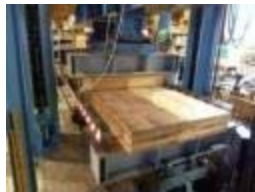
CLTの汎用性拡大に向けたCLT強度データ等の収集

○特に木材利用が低位で潜在的需要が大きく見込まれる都市部の中高層建築等をターゲットとした「都市の木質化」等を推進。