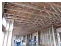
店舗等低層非住宅建築物の木質化に向けた取組の支援