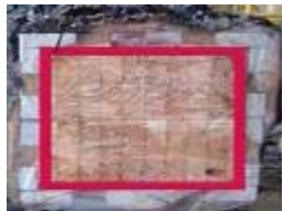
中高層建築物等の木造化に向けた木質耐火部材等の開発