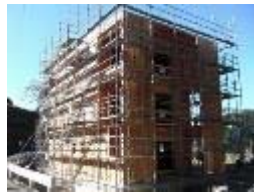
CLTの施工方法の確立及びコストダウンに向けたCLTを活用した先駆的建築の支援