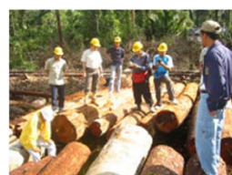
「クリーンウッド法」の施行に向け、違法伐採関連情報を提供。事業者登録の推進、協議会による教育・広報活動の取組を支援