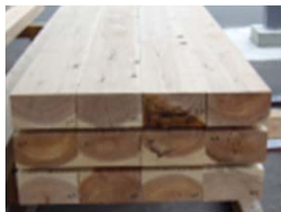
製材品の需要創出・高付加価値化等に向けた製品・技術の開発・普及