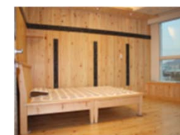
日本産木材により内装木質化したマンションモデルルームによる展示・PR等の取組を支援