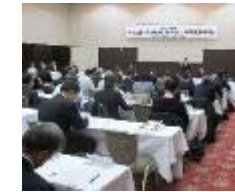
川上から川下の関係者、国有林及び都道府県が広域に連携した協議会での、需要見通し等に関する情報の共有化