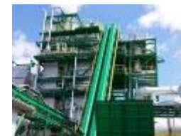
木質バイオマスの利用拡大に向けた相談窓口の設置、燃料の安定供給体制の強化、技術開発等の支援