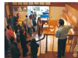
川上と川中、川下が行う地域材利用拡大の取組や、木づかいや森林づくりに対する国民の理解を醸成する普及啓発の取組への支援