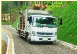
林業生産基盤整備道の整備

森林資源が充実した区域において、幹線となる林業生産基盤整備道等の整備を実施することで、原木の低コスト・安定供給に貢献