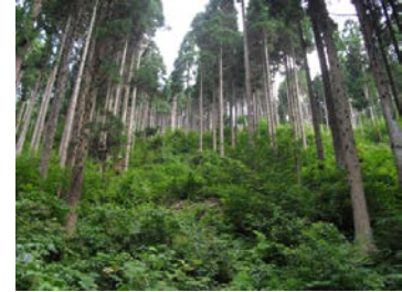
間伐の実施による健全な森林の整備