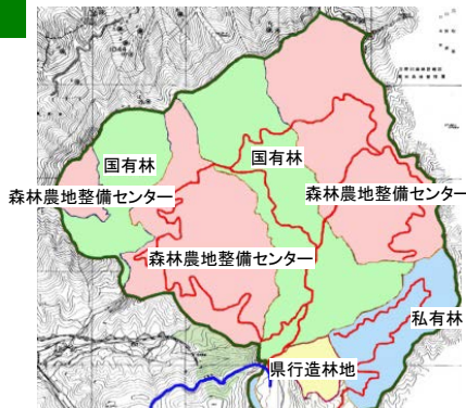
民有林と連携した路網の整備