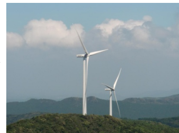
風力発電用地としての 国有林野の活用