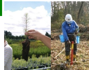
コンテナ苗(左)とその植付(右)