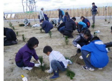
海岸防災林の再生