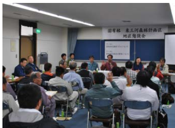
計画案作成に向けた 住民懇談会