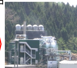
バイオマス発電所