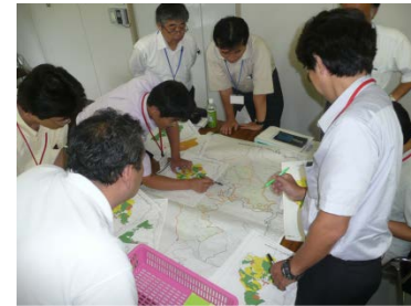
フォレスター育成の研修