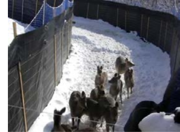
囲いわなによるシカの捕獲