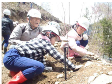
「法人の森林」を活用した ボランティアによる植樹活動