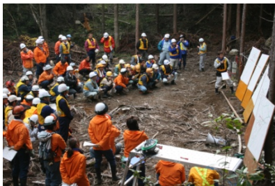
丈夫で簡易な道づくりの研修会