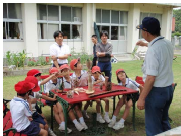
職員による小学校への出前授業