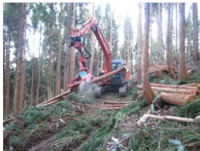
高性能林業機械を活用した作業システムの普及・定着