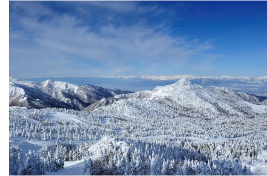
志賀高原