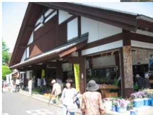
手づくりほんものセンター、照葉樹林