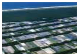
農地等を保全する森林

▶ 海岸林や防風林などの延長約7,300kmについて、海岸侵食や病虫害からの森林の保全等を行うことにより、近接する市街地、工場や農地などを保全する。