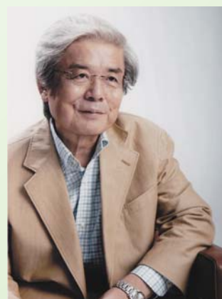
基調講演 養老孟司氏

お申込み F A X : 076-240-7076 (財)石川県緑化推進委員会 e-mail: isikawa.ryokusui@arrow.ocn.ne.jp