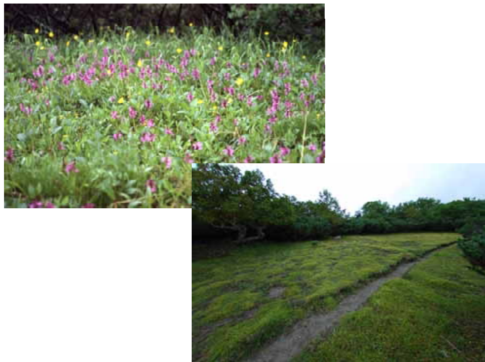
場 所：長野県伊那市 黒河内国有林 くるこうち 説 明：写真は、シカによる食害を受ける前（左上）と受けた後（右）の様子です。

事例 南アルプスの高山帯における高山植物の保護 南信森林管理署では、近年、南アルプスの高山帯においてシカによる高山植物への食害が目立っており、ホテイアツモリソウやアカイシ Lindow 等の南アルプス特有の高山植物の減少・絶滅などの影響が懸念されていることから、その被害状況の調査を行うとともに、具体的な保護方策についての検討を行いました。 調査の結果、シカ食害が広範囲に及んでいることが判明したため、平成20年度からシカ被害防止柵の設置に取り組んでいくことにしました。 (中部森林管理局 南信森林管理署)