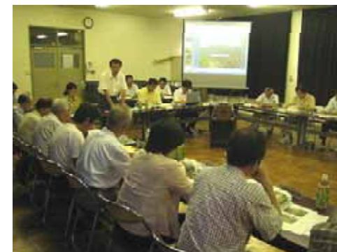
表 - 14 意見交換等の事例