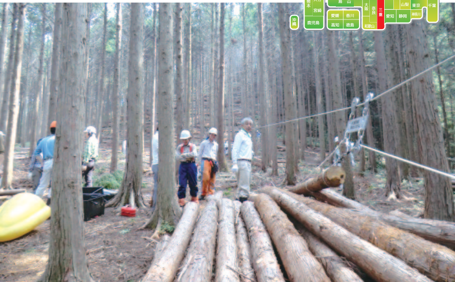
森林施業では、セミプロ集団として安全性・確実性を重視。

活動内容は、下刈り・地拵え・植樹・枝打ち・間伐・集材といった森林施業に加え、人材育成のための講習会開催や森林環境教育の実施、企業との連携、間伐材有効利用の推進など多岐にわたっています。