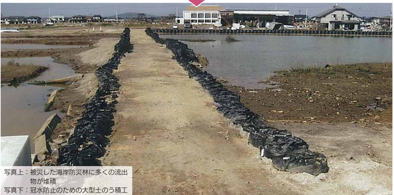
写真上：被災した海岸防災林に多くの流出物が堆積

津波により海岸林流失及び広域的な地盤沈下が発生。満潮時の周辺住宅地への冠水防止のため大型土のうを設置するとともに周辺の倒木及びガレキを処理。