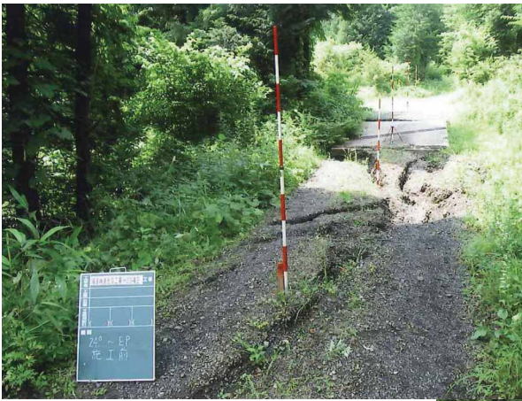
写真上：路体に入った大きなクラック 写真下：完成