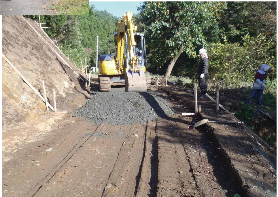
写真上：路体が隆起 写真下：舗装前の路面整正作業中

地震により林道 路体が約1.5m隆起。 路盤位置を変更す るとともに、幅員 を確保するなどの 工事を実施中。