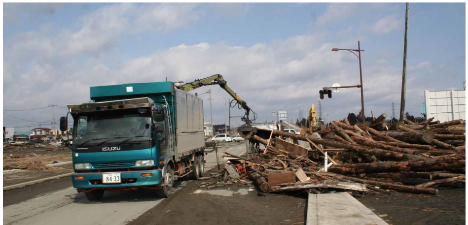
写真上：分別中 写真下：積み込み中

林業者・木材産業者が、自らの事業復旧や被災地域への復旧・復興資材の供給円滑化などのために必要な運転資金や設備資金について債務保証を実施。