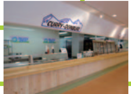
🌳 ヒノキ間伐材を利用した壁材を貼った信州大学の食堂