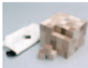
🌳 温かみがあり安全な間伐材の積み木(上)と、間伐材を活用した食器類等(左)