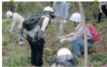
🌳 「コープの森」の下草刈り(コープこうべ)