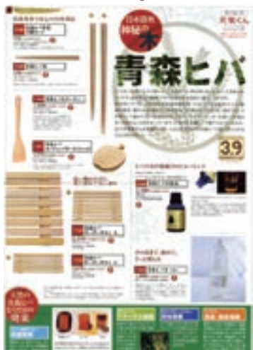
国産材製品を特集したチラシ