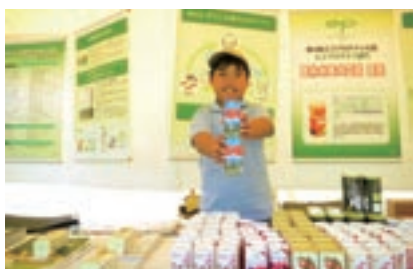
森林の市にブース出展

牛乳に含まれる各種ビタミンの残存率をみると、無菌充填の方がレトルト殺菌よりも残存率が高いことがわかります。