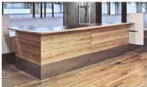
カウンターと床材に国産材を使用(立川市役所)