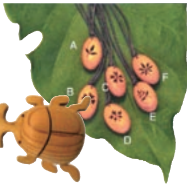
国産材を使用した 文具や小物

応用する意義「木材や使用方法の解説」などを説明し、木づかい運動の普及を行っています。