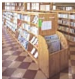
木の持つ温もりが感じられる書架(図書館)

地域 材活用により、地域資源の有効活用と地場産業の活性化に貢献し、家具から書架、床や壁などの内装に至るまで幅広い用途における地産地消を通じて、新たな製品価値を提案しようというエコニファの取組。国や地方自治体で活用を促進している間伐材製品は、グリーン購入法の対象にもなっています。