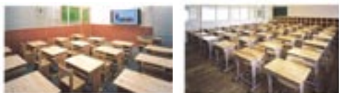
机と椅子、内装まで国産材を使用した教室

Econiffaは、「ECO」エコロジーと「Conifer」コニファー(針葉樹の意からの造語で、日本の森林の多くを占めている針葉樹(スギやヒノキ)を製品として活用するソリューション活動の名称です。「人も生き生き、地球も生き生き」をキーワードに、