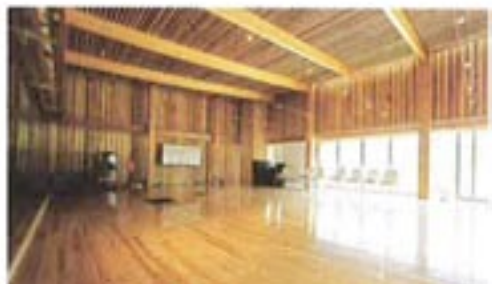
木の質感が新たな感性価値を生む (市営スポーツ施設)