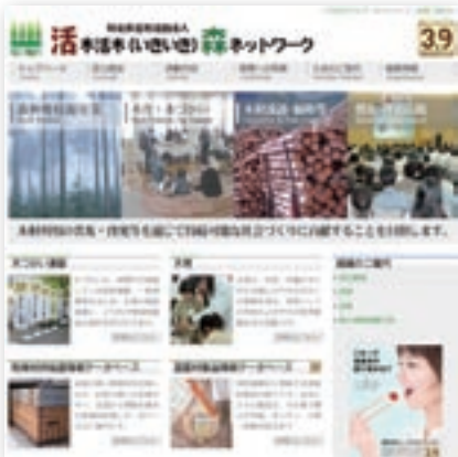
活木活木(いきいき)森ネットワーク http://www.iki-mori.net/

http://www.kidukai.com/ http://www.mokuiku.jp/ http://www.iki-mori.net/