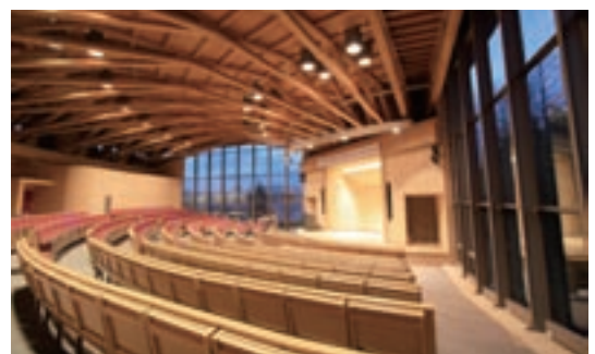
公立大学法人国際教養大学講義棟(秋田県)