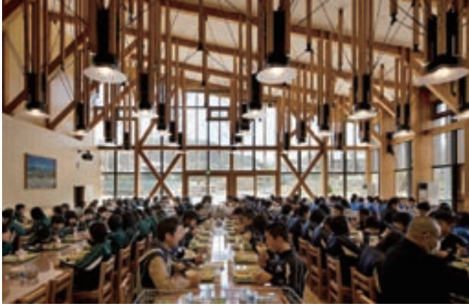
木のランチルーム(長野県川上村立川上中学校)