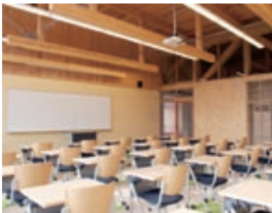
公立大学法人国際教養大学(教室)

の地域に密着した体制づくりなどが課題になります。 先月、公共建築物の木造化や内装の木質化などを推進する「公共建築物木材利用促進法」が公布されました。この法律を契機として、この工夫事例集も十分に活用され、あたたかみとつるおいのある木の学校づくりが一層進むことが期待されます。