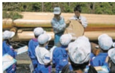
伐採した町有林の木材の見学 (栃木県茂木町立茂木中学校)

近年、木造の公立学校施設の割合は、平成20年度に約10%となるなど、確実に増加しており、非木造の公立学校施設でも、内装の木質化が行われています。