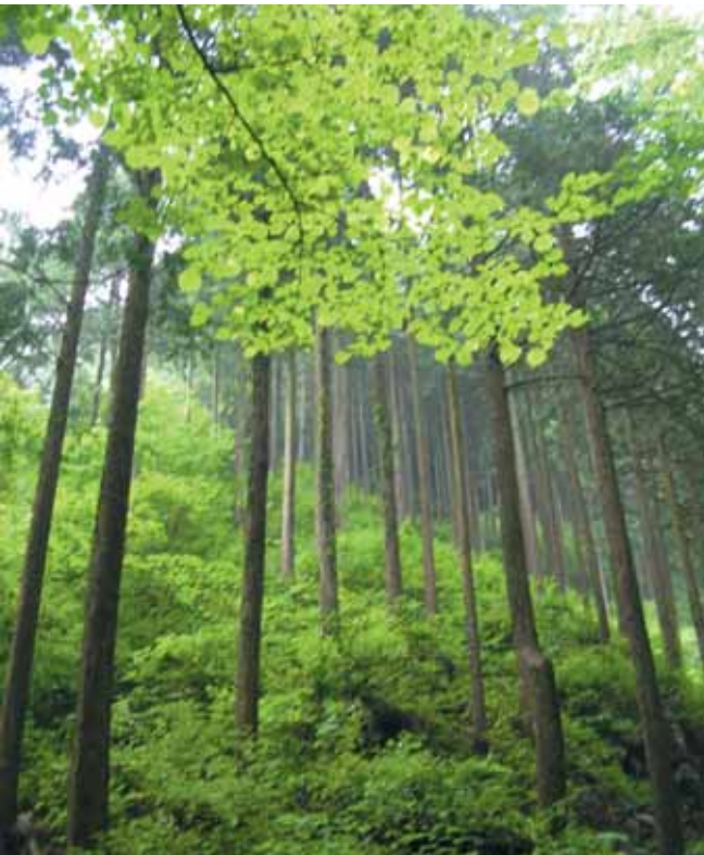
あきる野市にある整備中の森林

また、地域と連携を図り、木づかい運動に参加する企業や団体などもあらわれてきました。 木づかい推進月間である今回は、進化する木づかい運動の取り組みを紹介します。