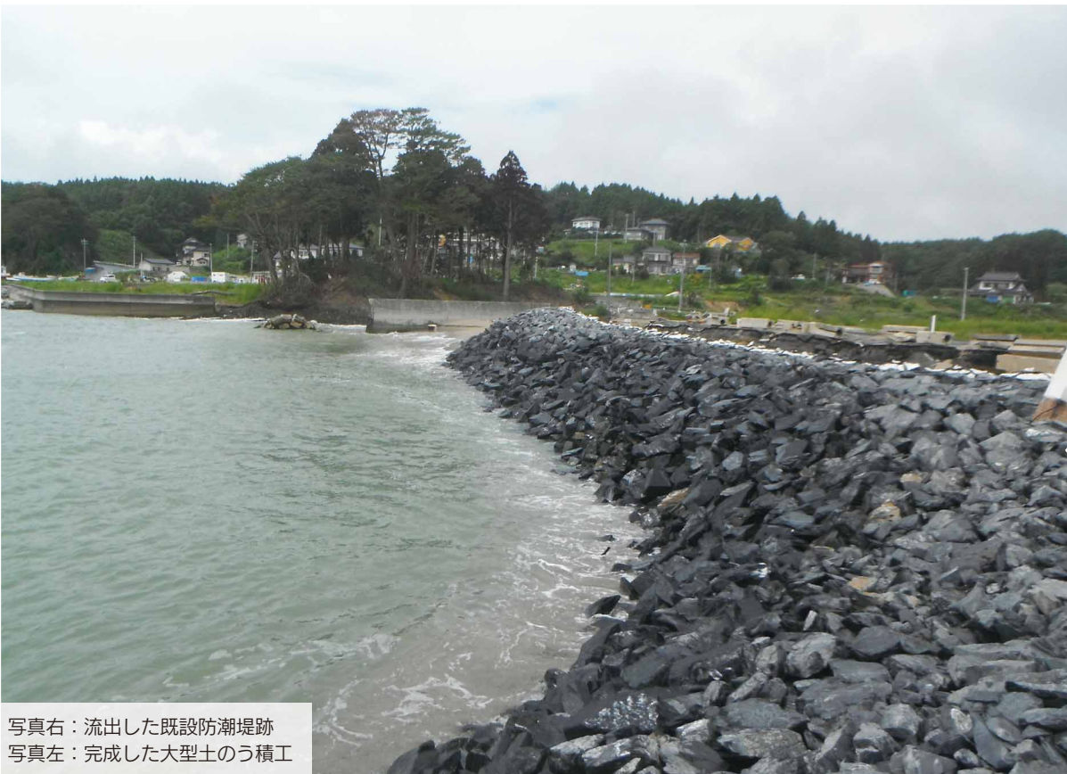
写真右：流出した既設防潮堤跡 写真左：完成した大型土のう積工