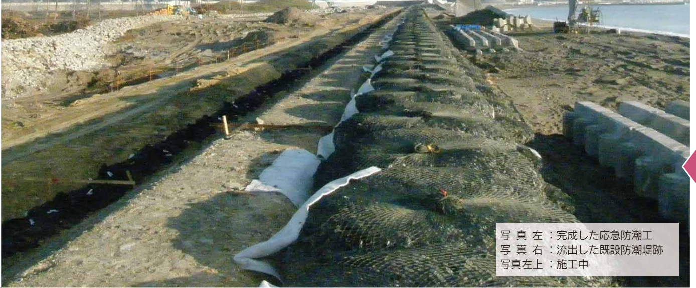
写真左：完成した応急防潮工 写真右：流出した既設防潮堤跡 写真左上：施工中