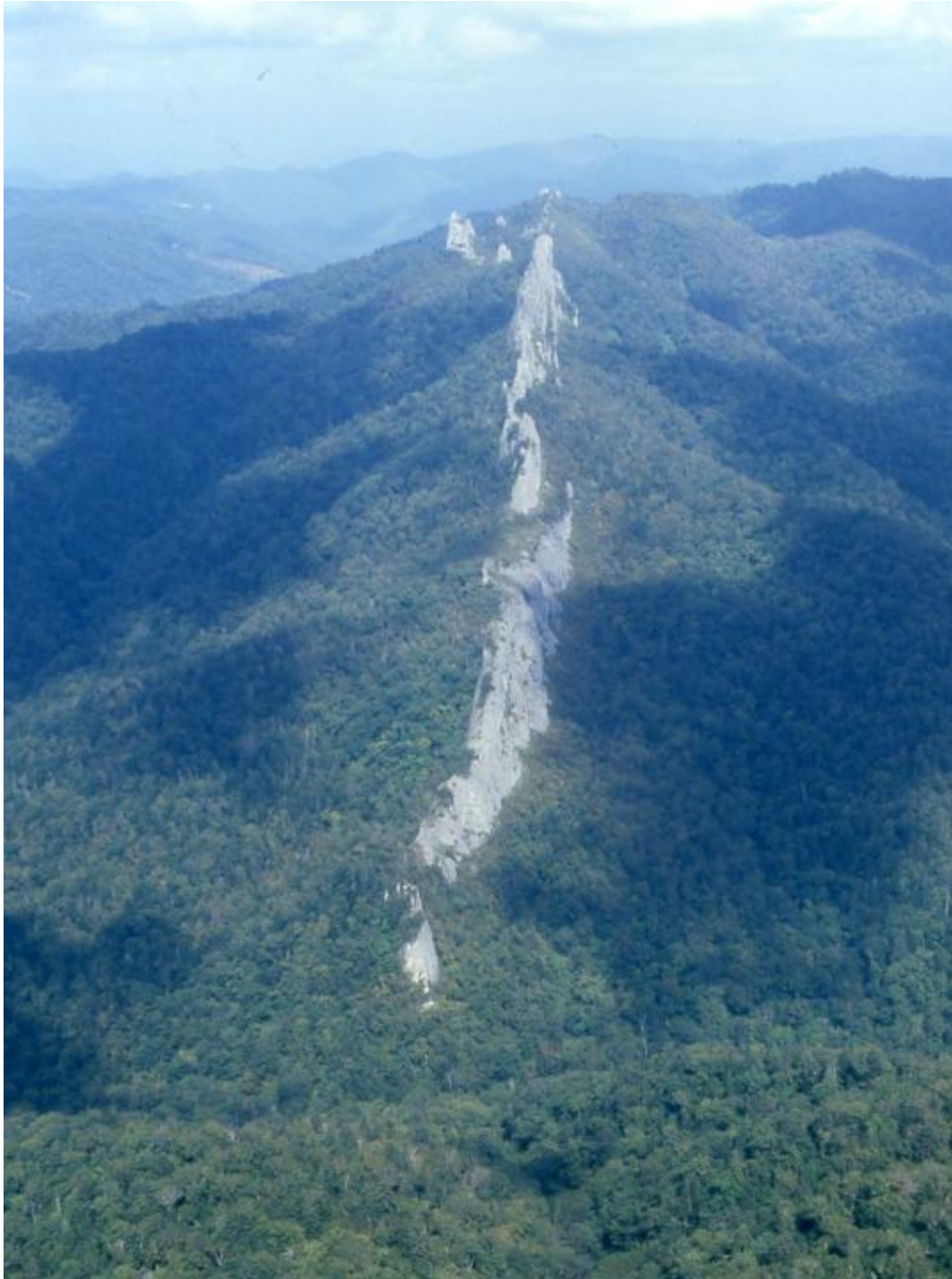
上空から見た南面 (ヘリコプターより)