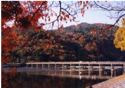
嵐山風景林 (京都府京都市)