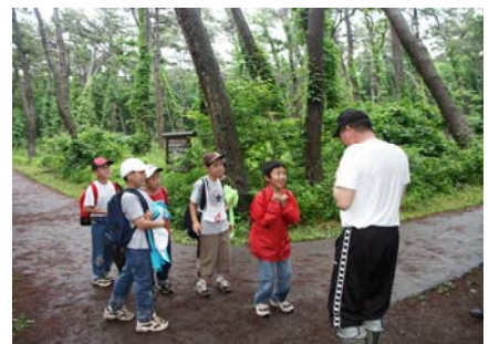
風の松原森林スポーツ林 (秋田県能代市)