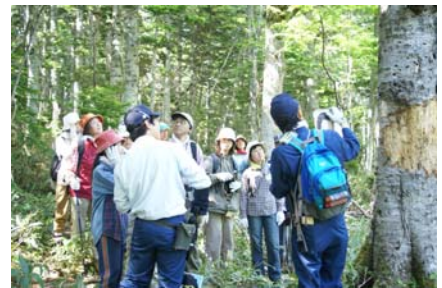
知床自然観察教育林 (北海道斜里町)