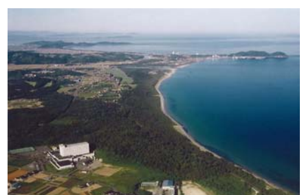
玄海風致探勝林 (福岡県宗像市)