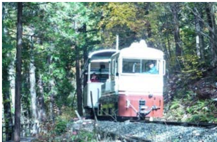
赤沢自然休養林 (長野県上松町)