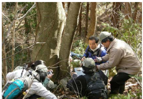
現地検討会の様子 (群馬県みなかみ町)

地域や森林の特色を活かした効果的な森林管理を実施すべき地域において、地域住民や参加・協力する民間団体等の間で合意形成を図りながら協働して実施する森林づくり活動を行うためのフィールド