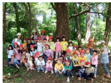
遊々の森での記念撮影 (山形県酒田市)