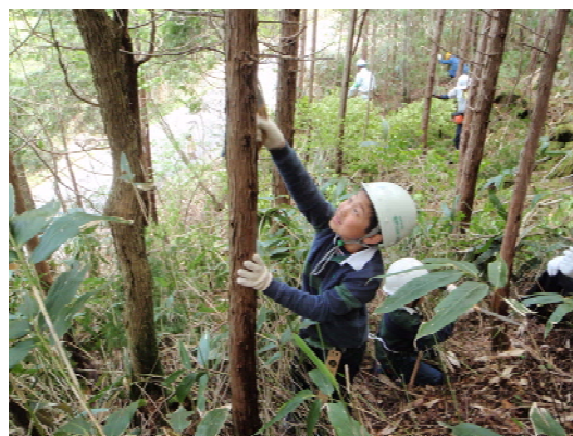
子どもたちによる森林整備（岐阜県中津川市）

森林をフィールドとしたボランティア活動に参加したいというニーズに応えるため、ボランティア団体等による自主的な森林づくり活動のためのフィールド