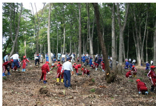
古事の森での記念植樹（岩手県奥州市）

地方公共団体などで構成される地域の協議会による植樹祭や下草刈などの活動が行われています。