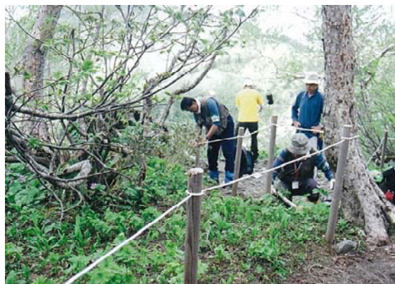
登山道の整備 (北海道夕張市)

林野巡視、歩道の草刈、自然観察、美化活動などの森林の保全活動を行うためのフィールド