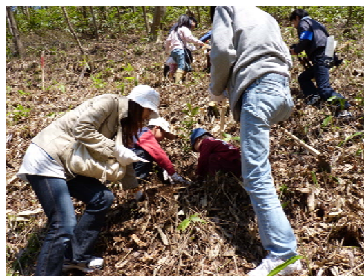
参加者による記念植樹（島根県雲南市）

地球温暖化防止など地球環境保全への関心が高まっている中、企業の社会的責任（CSR）活動などを目的とした森林整備活動の場としてのフィールド