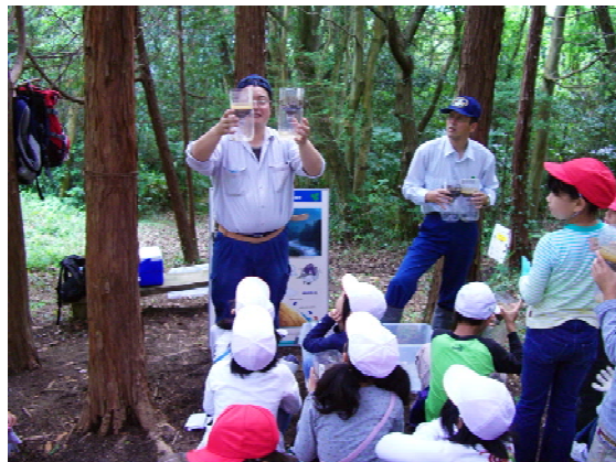
遊々の森での森林教室 (香川県高松市)

森林の利用を通じた子どもたちの人格形成や、幅広い知識の習得を行う森林環境教育の場として利用いただけます。