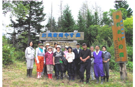
ふれあいの森での植樹祭後の記念撮影 (北海道占冠村)