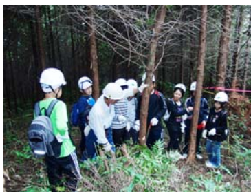
遊々の森での間伐体験 (熊本県熊本市)

なお、この協定では、実施主体は、協定対象森林における立木竹の所有権などを有しないこととなっています。