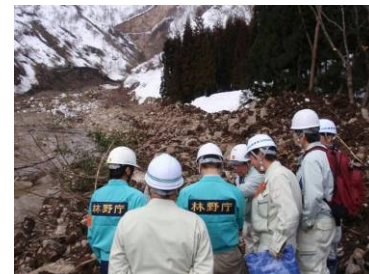
県の担当者とともに民有林の 現地調査を実施（長野県）