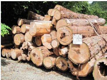
屋根葺き替え用資材の天然サワラ