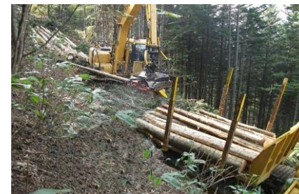
プロセッサによる造材作業と フォワーダによる搬出作業