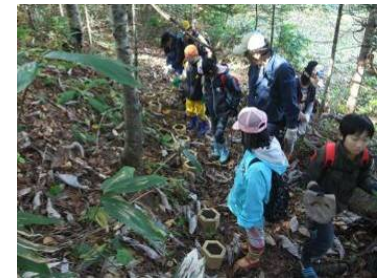
ドングリの蒔き付け