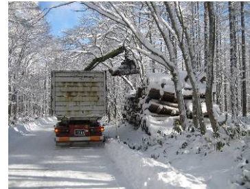
低質材のトラックへの積み込み