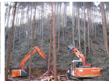
スイングヤードによる集材と プロセッサによる造材作業