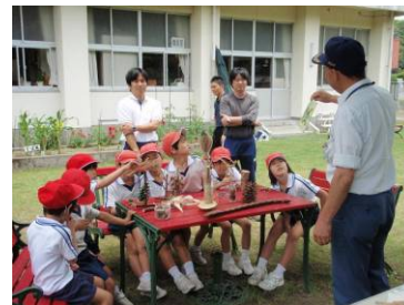
職員による小学校への出前森林教室