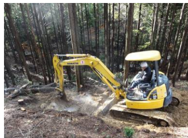
丈夫で簡易な作業道の整備