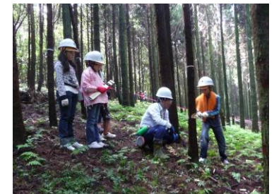
国有林での間伐体験