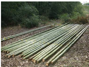
伝統行事用に切り出されたマダケ