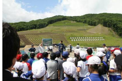
地元住民参加による植樹祭での現地説明