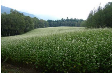
国有林野を活用したソバ栽培試験地

《事例》 地域振興のための国有林野のソバ栽培試験地としての貸付け 〔長野県小県郡青木村〕（中部森林管理局 東信森林管理署）