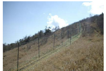
シカ防護用ネットの設置状況