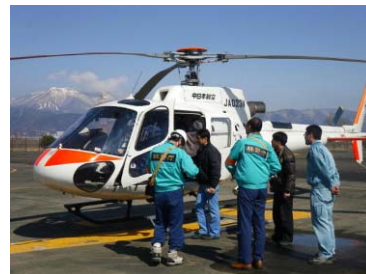
現地調査に向かうヘリコプター (長野県)

〔岩手県、宮城県、福島県、長野県ほか〕 〔北海道、東北、関東、中部の各森林管理局〕