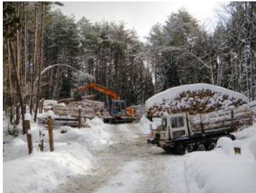
民有林と国有林が共用する土場