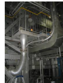
木質バイオマス ボイラー