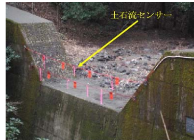
既存の治山施設に設置した土石流センサー