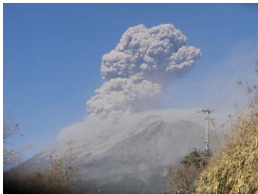
霧島山(新燃岳)の噴火

《事例》霧島山(新燃岳)噴火への緊急対策の実施 〔宮崎県都城市〕(九州森林管理局 宮崎森林管理署都城支署)