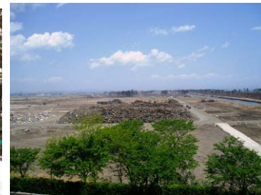
国有林を無償貸付した、 がれきの一時置場の様子