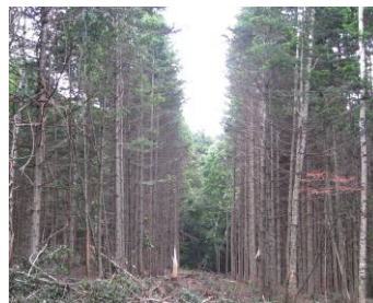
列状間伐実施後の林内