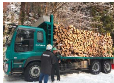
仮設住宅土台用杭丸太向け原木の輸送