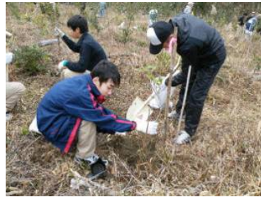
高校生による植樹