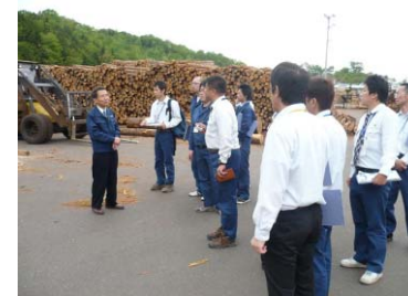
民間の木材加工工場の見学