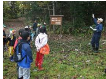
職員による森林の役割の説明

《事例》「遊々の森」を活用した森林環境教育の実施 〔北海道苫前郡羽幌町〕(北海道森林管理局 留萌北部森林管理署)