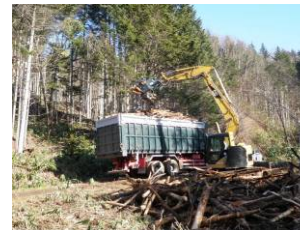
林地残材の積込作業