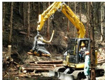
ハーベスタの操作体験