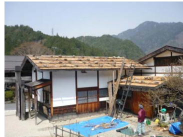
屋根の葺き替え作業