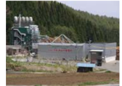
木質バイオマス発電所