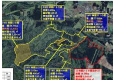
民有林と国有林の連携箇所の模式図