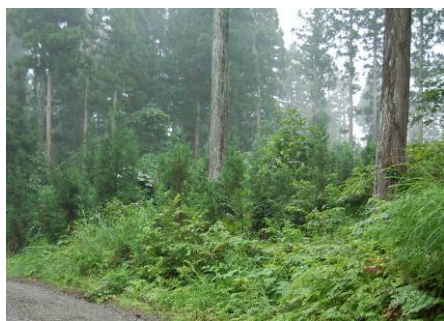
育成複層林施業地

まむろがわ 〔山形県最上郡真室川町〕 (東北森林管理局 山形森林管理署最上支署)