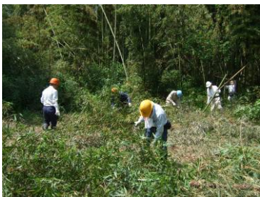
ボランティア団体と連携した竹林整備