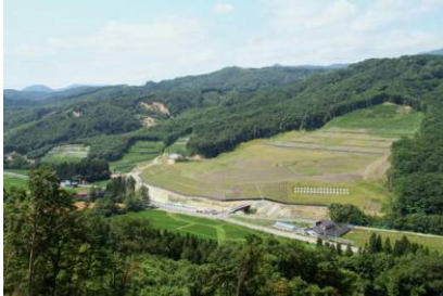
平成20年岩手・宮城内陸地震による地すべり発生箇所の復旧状況

《事例》地域の安全・安心への取組(民有林直轄治山事業) 〔岩手県一関市〕(東北森林管理局 岩手南部森林管理署)