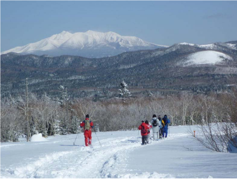
斜里岳を望みながらのスノーハイキング（北海道森林管理局）