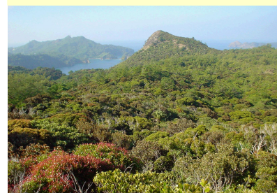
小笠原諸島森林生態系保護地域の設定 (東京都小笠原村) 関東森林管理局

国有林野に多く残されている原始的な森林生態系や貴重な動植物種が生息・生育する森林を保護林として設定し、その保全・管理に努めています。