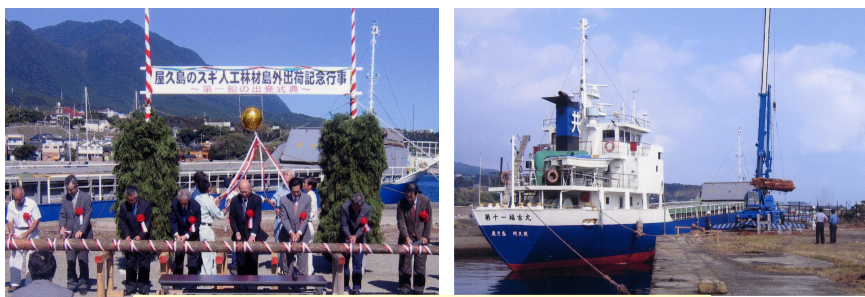
離島からの人工林間伐材の島外出荷 〔鹿児島県熊毛郡屋久町〕 九州森林管理局 屋久島森林管理署

ダム用地や都市住民のための緑地等として、地域産業の振興や住民の福祉の向上等に必要な森林について、公益的機能の発揮等に十分配慮しつつ、売り払いを行っています。