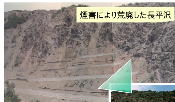
煙害により荒廃した長平沢