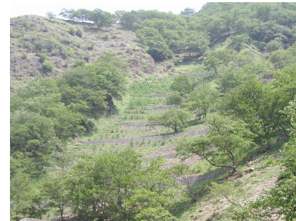
治山施設の整備 〔栃木県日光市〕 関東森林管理局 日光森林管理署

このほか、土砂崩れや土砂の流出による森林荒廃の回復や防止のための治山施設の整備も行っています。