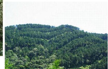
複層林施業 〔高知県四万十市〕 四国森林管理局 四万十森林管理署

このほか、土砂崩れや土砂の流出による森林荒廃の回復や防止のための治山施設の整備も行っています。