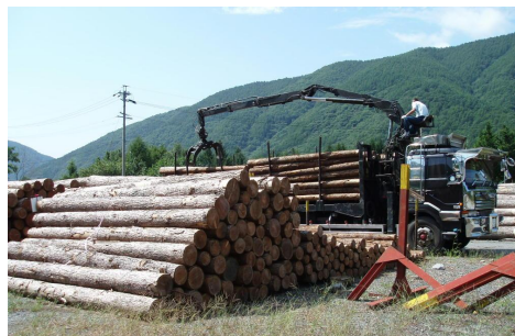
搬出された間伐材 〔長野県木曾郡木祖村〕 中部森林管理局 木曾森林管理署

安全で安心できる暮らしを実現することを目的に、治山事業により、荒廃地の復旧整備や保安林の整備を計画的に進めるとともに、迅速な災害対応に努めました。