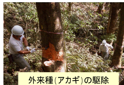
外来種(アカギ)の駆除