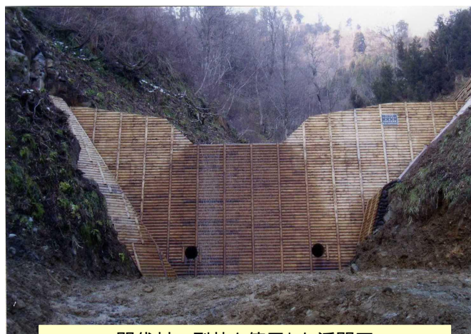
間伐材の型枠を使用した溪間工 (秋田県秋田市) 東北森林管理局 秋田森林管理署