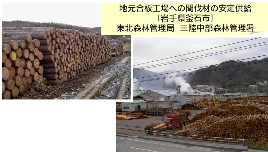
地元合板工場への間伐材の安定供給 〔岩手県釜石市〕 東北森林管理局 三陸中部森林管理署

販売に当たっては、集成材・合板工場や大手住宅メーカーへ納入している製材工場等、これまで主として外材を利用してきた大口の需要者に対して、原材料となる木材を安定的に供給する「システム販売」を推進することにより、国産材の需要拡大にも努めています。