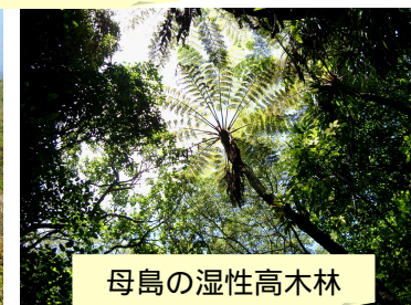
母島の湿性高木林