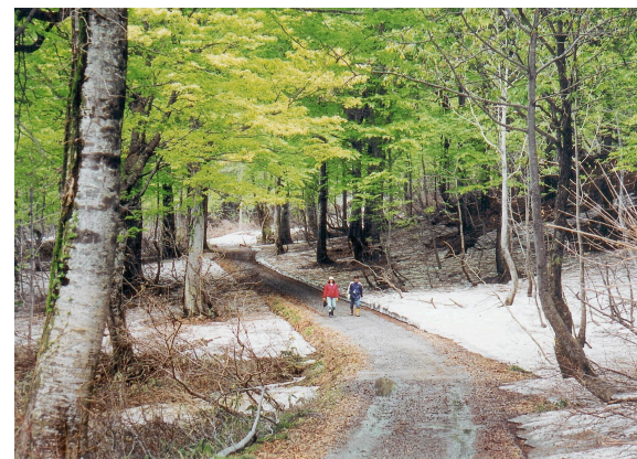
森林セラピー基地のためのフィールド提供 〔山形県置賜郡小国町〕 東北森林管理局 置賜森林管理署

地域振興に取り組んでいる地方公共団体に対しフィールド提供等を通じて貢献しています。