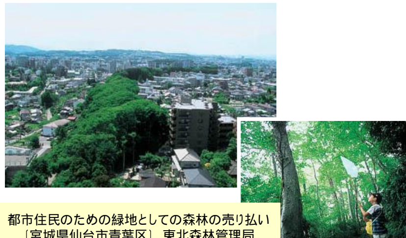
都市住民のための緑地としての森林の売り払い 〔宮城県仙台市青葉区〕東北森林管理局

ダム用地や都市住民のための緑地等として、地域産業の振興や住民の福祉の向上等に必要な森林について、公益的機能の発揮等に十分配慮しつつ、売り払いを行っています。