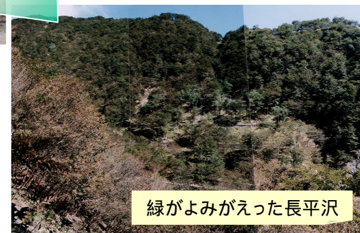
緑がよみがえった長平沢