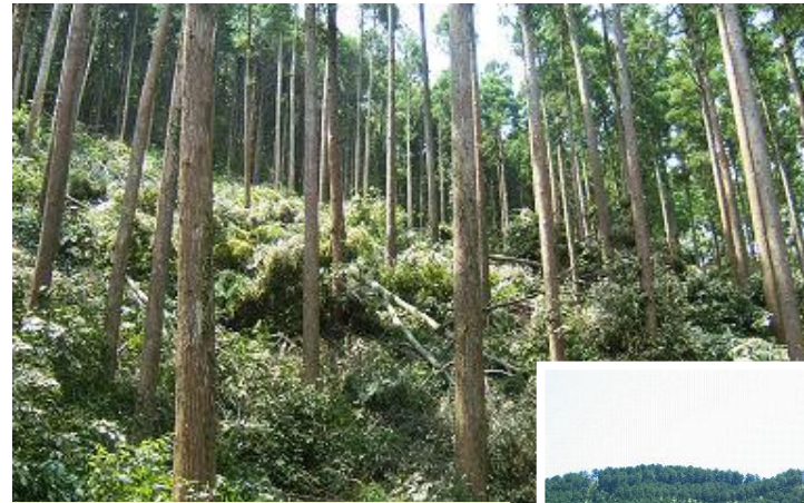
長伐期施業 〔愛媛県北宇和郡松野町〕 四国森林管理局 愛媛森林管理署

100年程度の長い周期で伐採や植林を繰り返す長伐期施業や、育成複層林施業等を行っています。