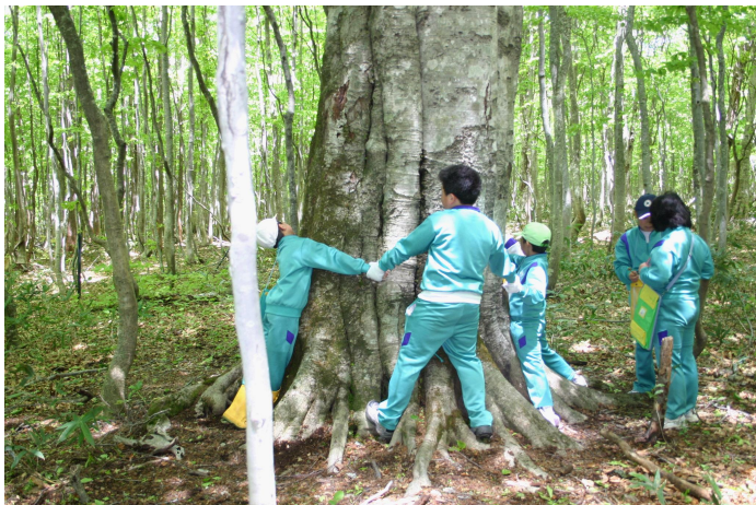
「遊々の森」を活用した森林環境教育の支援 (岩手県八幡平市) 東北森林管理局 岩手北部森林管理署

「森林環境教育」の実践の場として国有林野を利用いただけるよう、学校等と森林管理署等とが協定を結び、国有林の豊かな森林環境を子どもたちに提供して、様々な自然体験や自然学習を進めていただく「遊々の森」の設定を進めています。