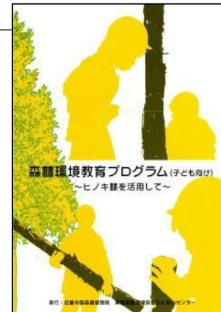
森林環境保全ふれあいセンターの取組 近畿中国森林管理局 箕面森林環境保全ふれあいセンター