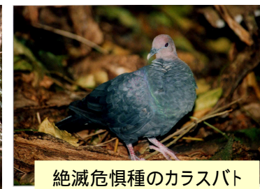
絶滅危惧種のカラスバト