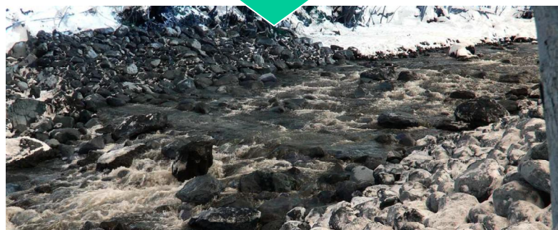
魚類の生態系に配慮した治山工事 〔北海道斜里郡斜里町〕 北海道森林管理局 網走南部森林管理署

間伐等の森林整備を高性能林業機械を活用して低コストで効率的に推進するため、基幹となる林道と組み合わせて継続的に利用する作業道等を整備しています。