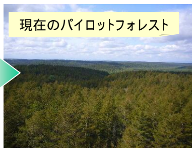
現在のパイロットフォレスト