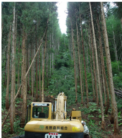
列状間伐 〔長野県長野市〕 中部森林管理局 北信森林管理署

森林の健全性の維持増進を図るため、間伐材の有効活用を努めながら、間伐を推進しました。