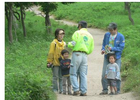
世界自然遺産での森林保護員の活動 (北海道斜里郡斜里町) 北海道森林管理局 網走南部森林管理署

世界自然遺産や日本百名山など入込者が集中し、植生への影響が懸念される国有林野で、巡視やマナーの啓発活動を行っていただくグリーン・サポート・スタッフ(森林保護員)を国民から募集しました。