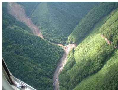
ヘリコプターによる迅速な災害調査 〔長野県上伊那郡辰野町〕 中部森林管理局

安全で安心できる暮らしを実現することを目的に、治山事業により、荒廃地の復旧整備や保安林の整備を計画的に進めるとともに、迅速な災害対応に努めました。